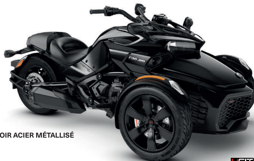
NOIR ACIER MÉTALLISÉ